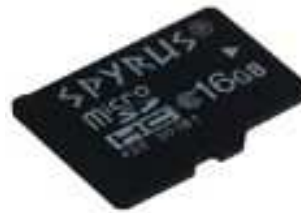
Rosetta micro SDHC