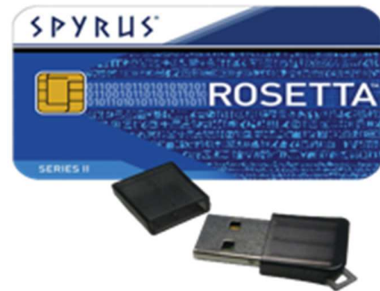
Rosetta Smart Card e Rosetta USB